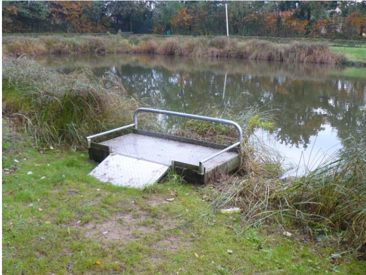
Eazy Spot Diepvenneke Vosselaar