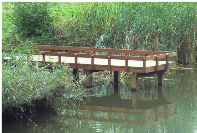
Eazy Spot Ieperse Vesten